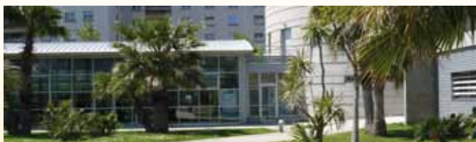
Espace Forme du CREPS