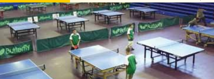
Salle d'entraînement de Montpellier TT

Une fois titulaire du DEJEPS mention tennis de table, il exercera des missions : d' entraînement , de formation de cadres , d' agent de développement territorial et de gestionnaire de structures . Ces activités s'exercent notamment dans le cadre de structures sportives affiliées à la Fédération Française de Tennis de Table, de comités territoriaux ou départementaux.