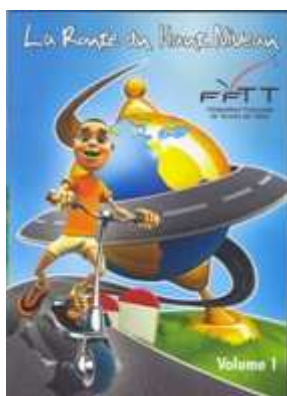
Le CD ROM de la route du haut niveau