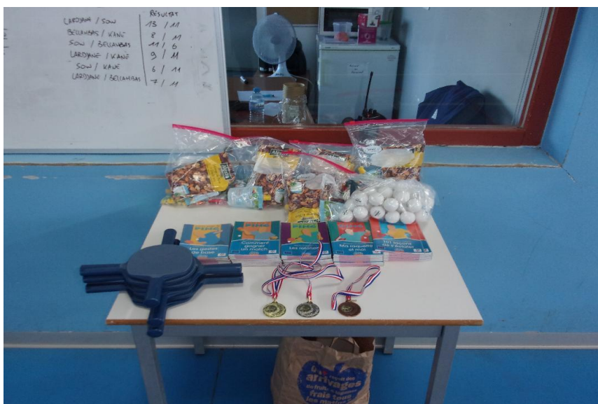
Raquettes et livrets offerts par la FFTT

* s'agissant de mineurs leur anonymat doit être respecté.