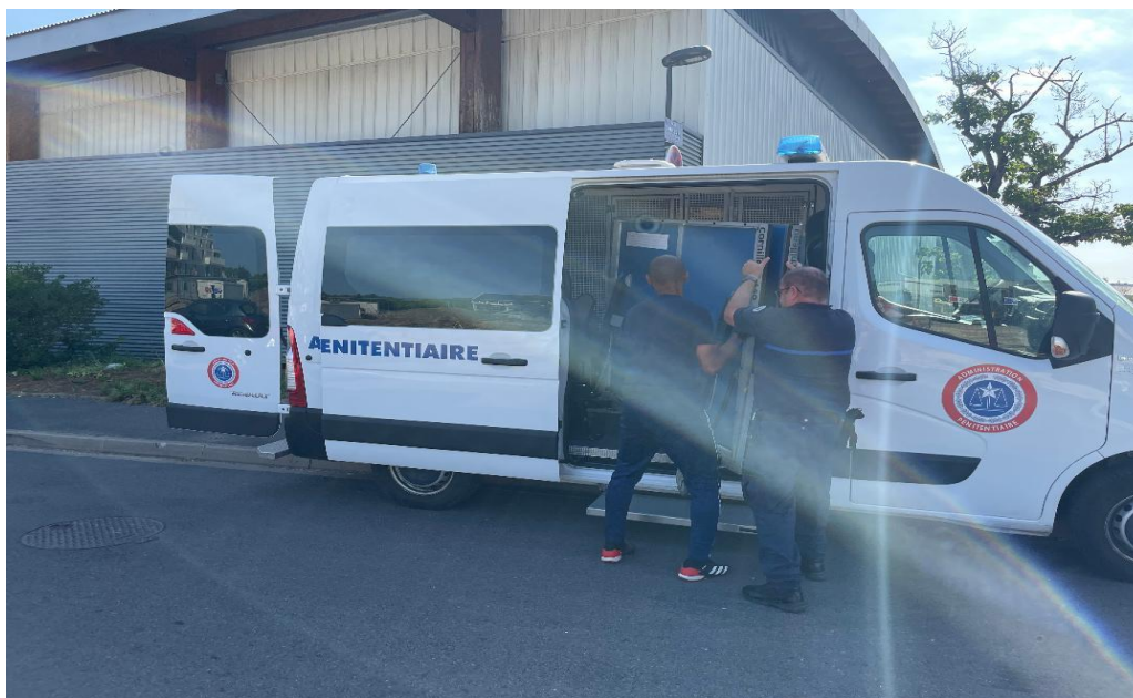
Chargement de la table par le personnel pénitentiaire