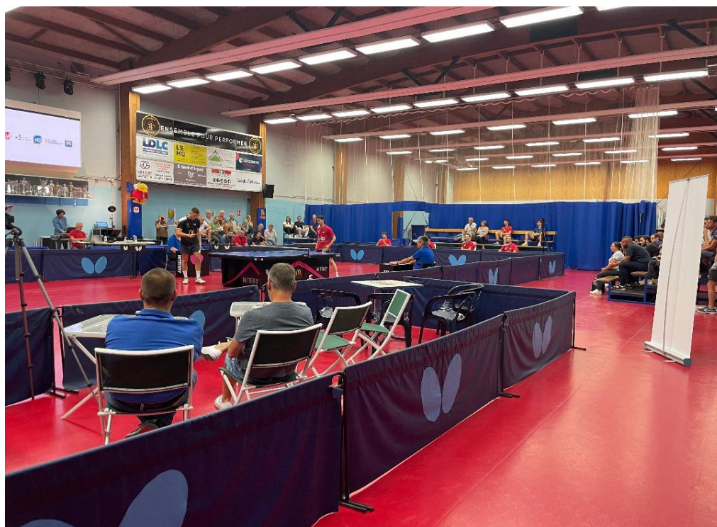
VUE DE LA SALLE ET DE L'AIRE D'ACCEUIL PENDANT LA RENCONTRE