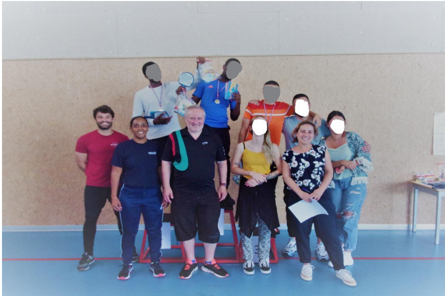
Les organisatrices, le président du club et les participants